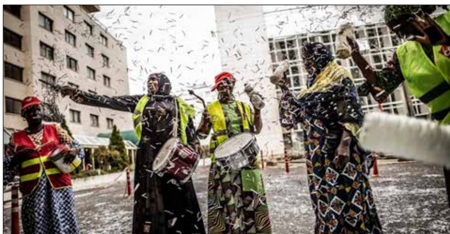
Grévistes de l'hôtel Ibis Batignolles